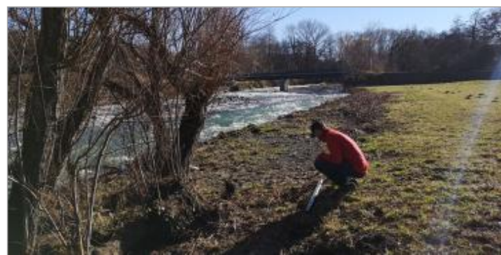
Vue de la laisse - Auteur : Schapi