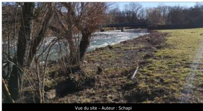
Vue du site - Auteur : Schapi