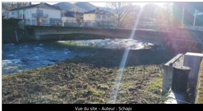
Vue du site - Auteur : Schapi