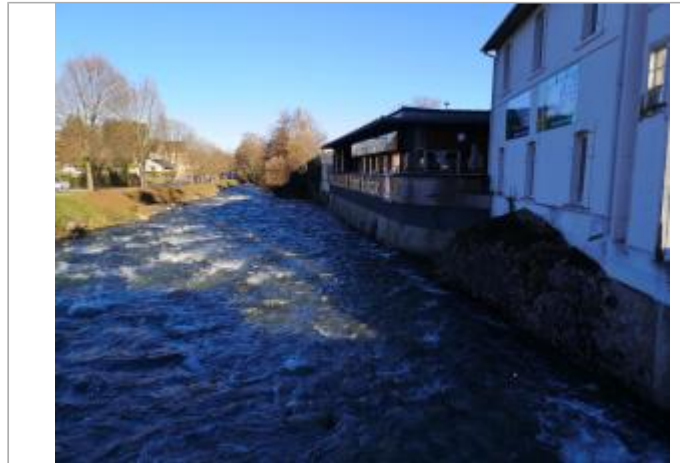
Vue du site - Auteur : Schapi