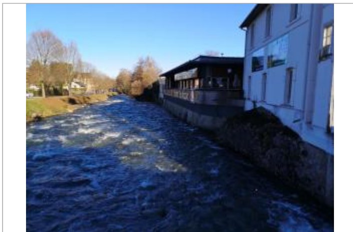
Vue du site - Auteur : Schapi