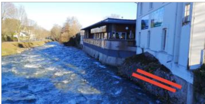
Vue de la laisse - Auteur : Schapi