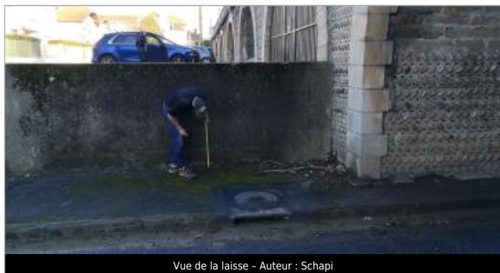
Vue de la laisse - Auteur : Schapi