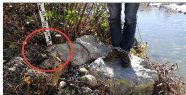
Vue de la laisse - Auteur : Schapi

GÉNÉRAL Code : GAD_ADA21_R_09_1 Date de mise à jour : 01/02/2022 Auteur : SPC GAD