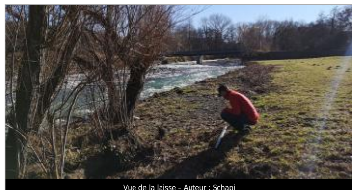
Vue de la laisse - Auteur : Schapi