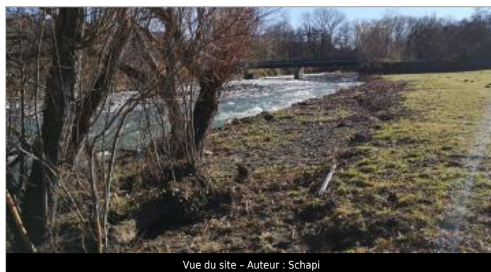
Vue du site - Auteur : Schapi