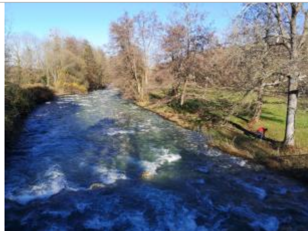
Vue du site - Auteur : Schapi