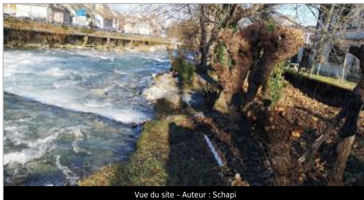
Vue du site - Auteur : Schapi