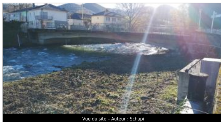
Vue du site - Auteur : Schapi

GÉOLOCALISATION Coordonnées WGS84 : X: 0.15492950 / Y: 43.06126410 Coordonnées RGF93 (Lambert 93) X: 468098.56 / Y: 6222173.84 Coordonnées RGF93 (ETRS89) : X: 0.1549295 / Y: 43.0612641 Code Hydro: Q---0000 Rive de référence: Gauche