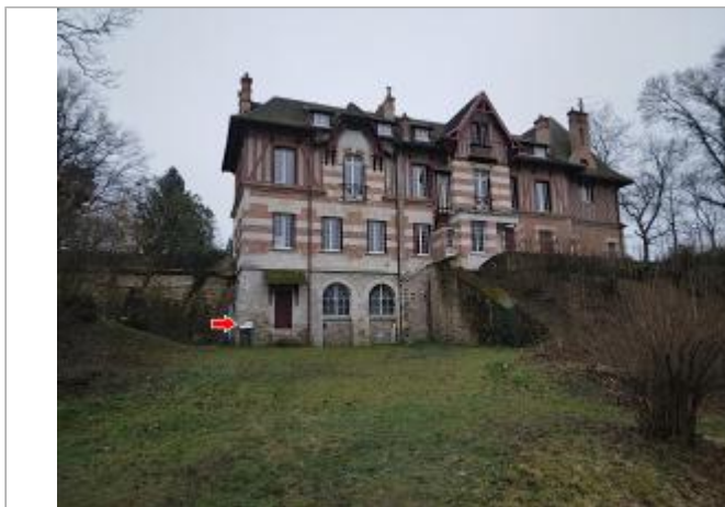
Vue du site en 2022