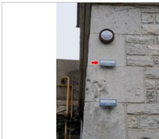
Vue du repère en 2022