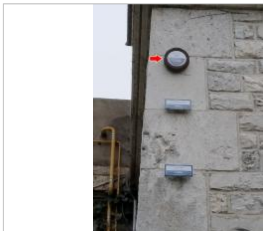
Vue du repère en 2022