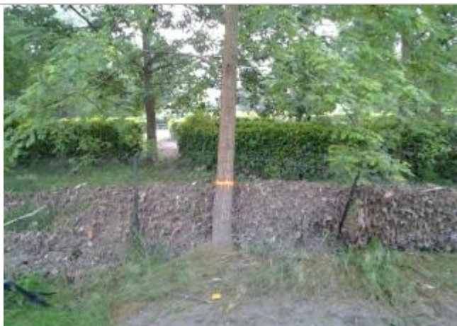
Vue du repère (le trait orange représente le niveau atteint par les eaux)

Altitude calculée de l'eau (en m) : 294.86 m