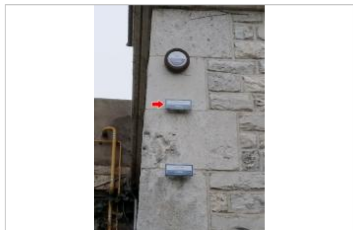
Vue du repère en 2022

MARQUE Texte : 27 septembre 1866 / Loire Maximum de l'inondation : Oui Visibilité : Oui État du repère : Bon Pérennité : Longue