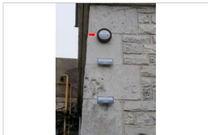
Vue du repère en 2022

MARQUE Texte : 20 Octobre 1846 / Plus hautes Eaux Connues / Loire Maximum de l'inondation : Oui Visibilité : Oui État du repère : Bon Pérennité : Longue