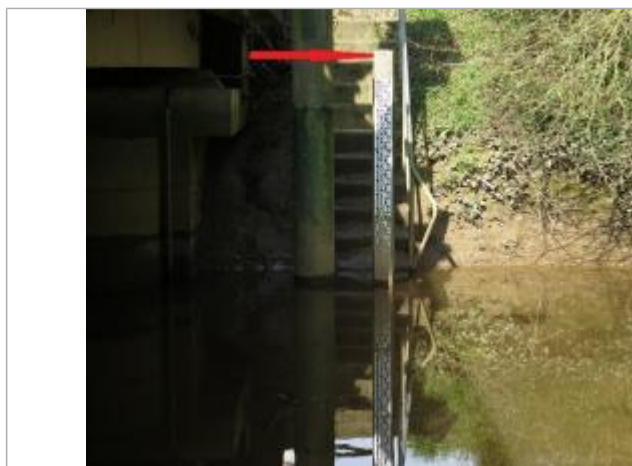
Echelle limnimétrique de la station sur l'Illet

Altitude calculée de l'eau (en m) : 46.27 m