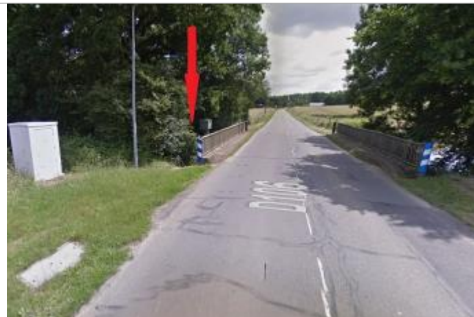
Station limnimétrique de l'Illet sous le pont de la RD 106