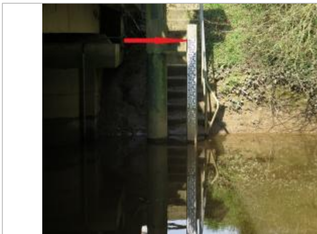
Echelle limnimétrique de la station sur l'Illet

Altitude calculée de l'eau (en m) : 46.09 m