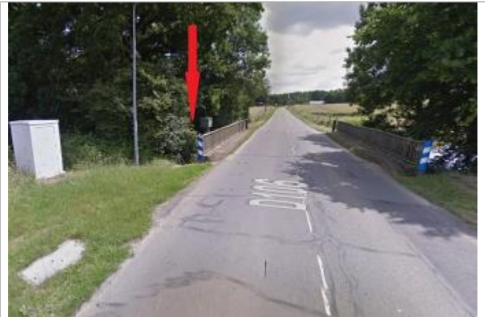
Station limnimétrique de l'Illet sous le pont de la RD 106