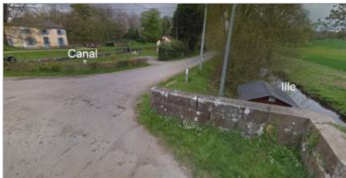
Station limnimétrique de l'Ille à Montreuil-sur-Ille (écluse Ille)