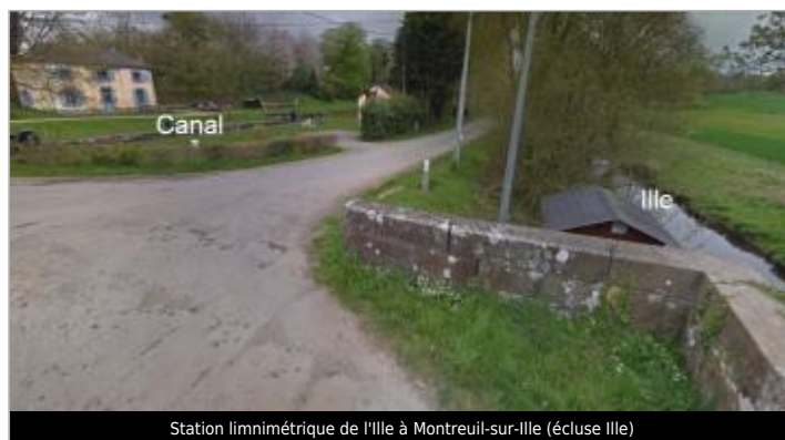
Station limnimétrique de l'Ille à Montreuil-sur-Ille (écluse Ille)

GÉOLOCALISATION Coordonnées WGS84 : X: -1.67247040 / Y: 48.29629230 Coordonnées RGF93 (Lambert 93) X: 353679.72 / Y: 6809801 Coordonnées RGF93 (ETRS89) : X: -1.6724704 / Y: 48.2962923 Code Hydro: J71-0300 Rive de référence: Gauche