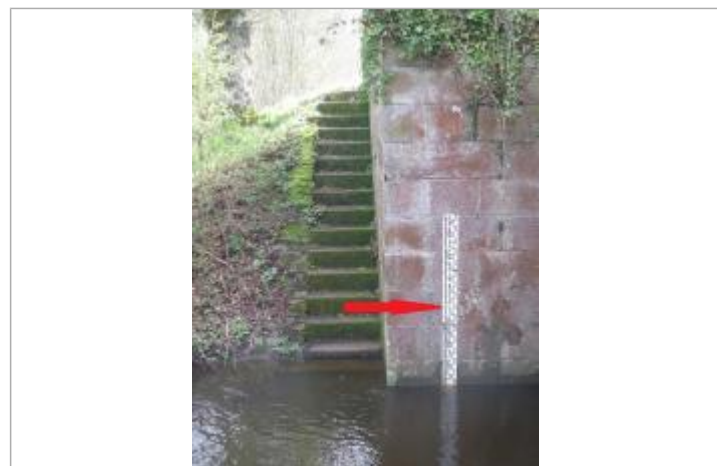
Echelle limnimétrique en amont du pont

GÉNÉRAL Code : SPC_35195_02_2019 Date de mise à jour : 22/05/2022 Auteur : SPC VCB