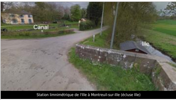
Station limnimétrique de l'Ille à Montreuil-sur-Ille (écluse Ille)

GÉOLOCALISATION Coordonnées WGS84 : X: -1.67247040 / Y: 48.29629230 Coordonnées RGF93 (Lambert 93) X: 353679.72 / Y: 6809801 Coordonnées RGF93 (ETRS89) : X: -1.6724704 / Y: 48.2962923 Code Hydro: J71-0300 Rive de référence: Gauche