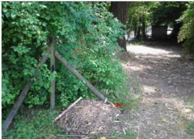
Vue du repère (l'eau est arrivée au pied du poteau au niveau de la marque orange) - Auteur : HEA/DDTM 64