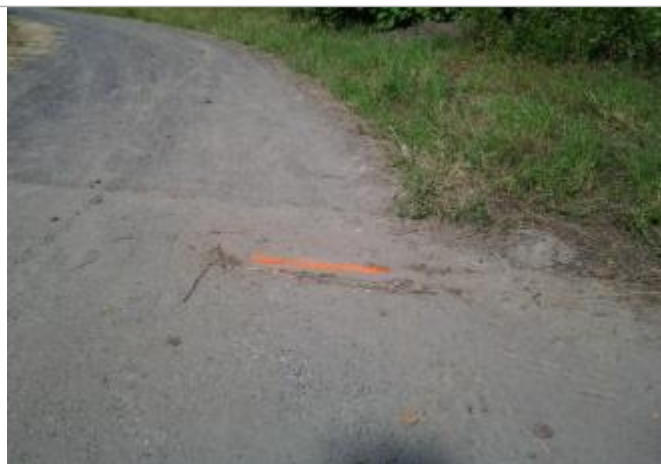
Vue du repère (le trait orange représente la limite de l'inondation)