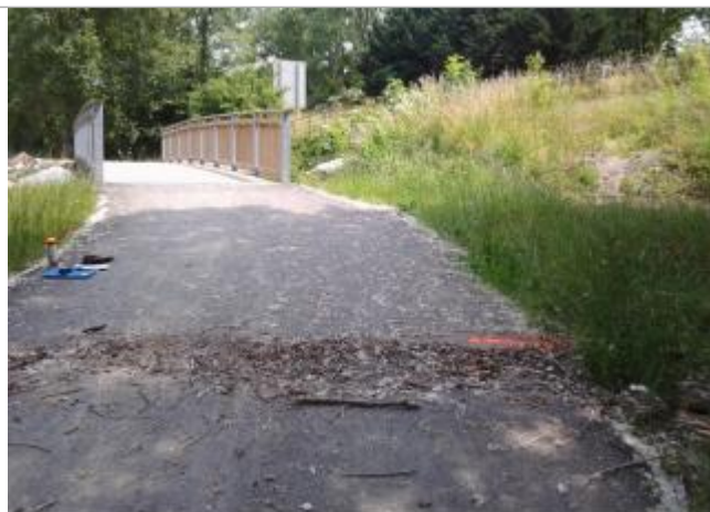
Vue du repère (le trait orange représente la limite de l'inondation)