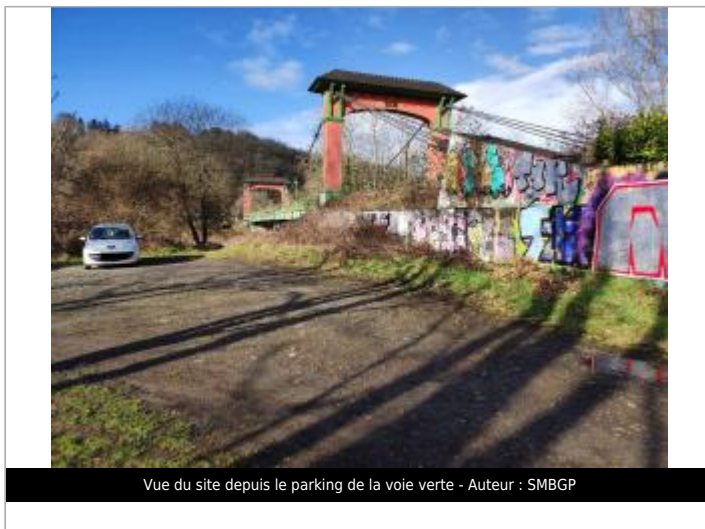
Vue du site depuis le parking de la voie verte