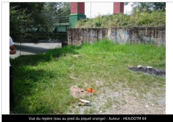
Vue du repère (eau au pied du piquet orange) - Auteur : HEA/DDTM 64

Code : WEB_R_202201273631 Date de mise à jour : 27/01/2022 Auteur : SMBGP