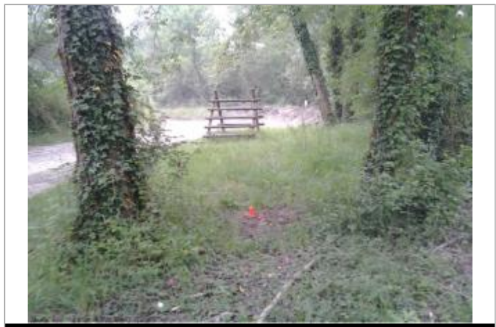
Vue du repère (l'eau est arrivée au pied du piquet orange)

GÉNÉRAL Code : WEB_R_202201273008 Date de mise à jour : 17/02/2022 Auteur : SMBGP