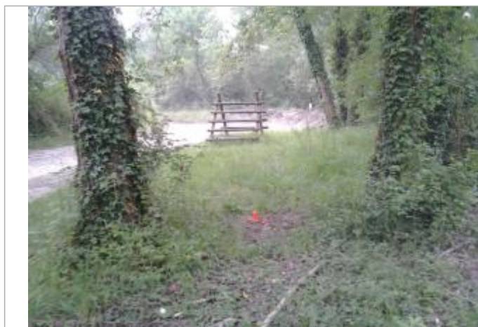
Vue du repère (l'eau est arrivée au pied du piquet orange)