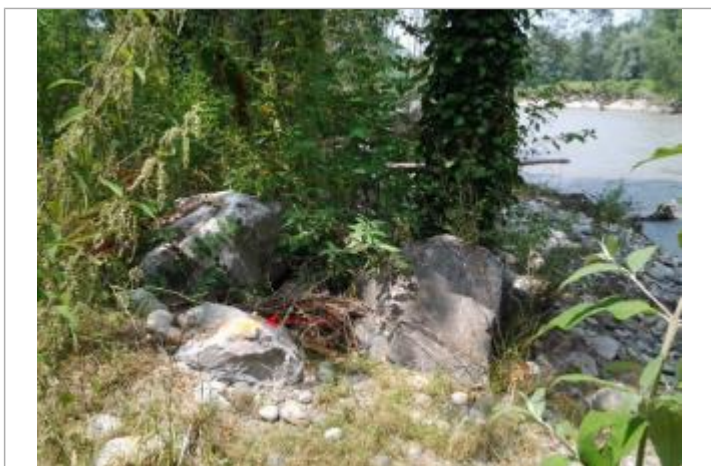
Vue du repère (la flèche rouge représente le niveau atteint par les eaux) - Auteur : HEA/DDTM 64

Type de repérage : Campagne de terrain post-inondation