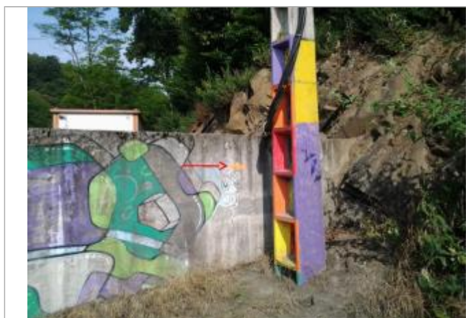
Vue du repère (la flèche rouge représente le niveau atteint par les eaux)