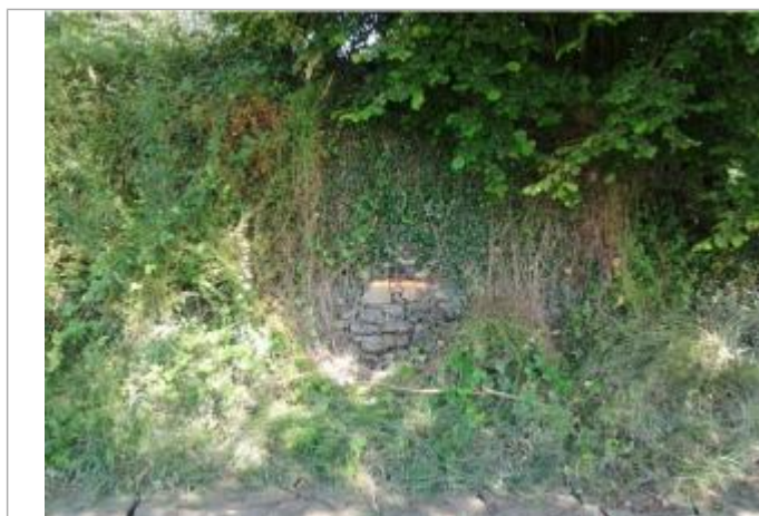
Vue du repère (la peinture orange représente le niveau atteint par les eaux)

Code : WEB_R_202201262508 Date de mise à jour : 17/02/2022 Auteur : SMBGP