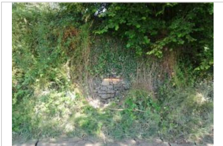
Vue du repère (la peinture orange représente le niveau atteint par les eaux) - Auteur : HEA/DDTM 64