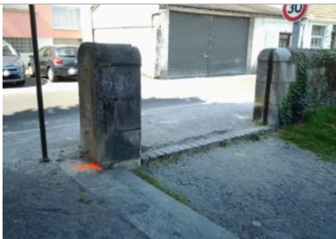
Vue du repère (la peinture orange représente le niveau atteint par les eaux)

Type de repérage : Campagne de terrain post-inondation