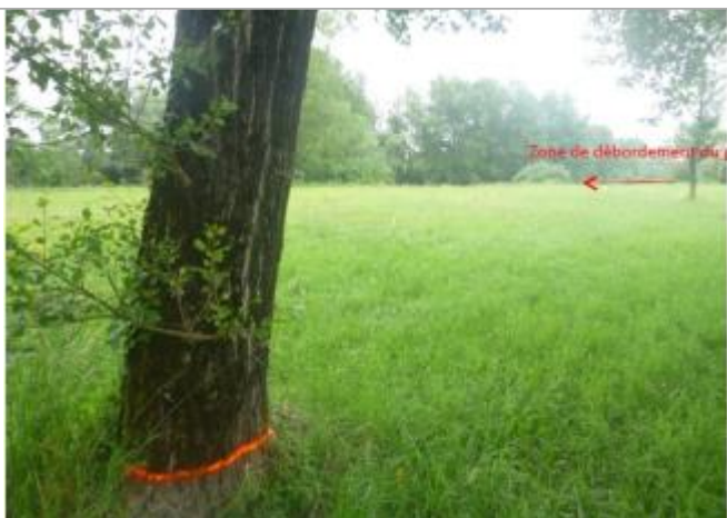
Vue du repère sur l'arbre (la peinture orange représente le niveau atteint par les eaux)