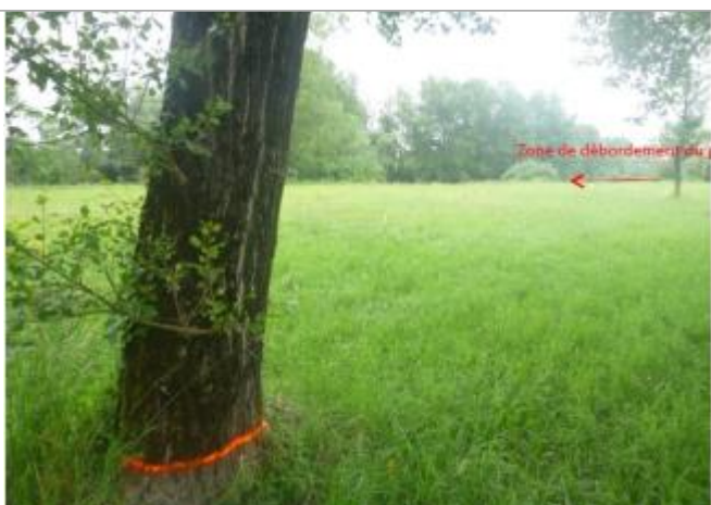
Vue du repère sur l'arbre (la peinture orange représente le niveau atteint par les eaux)