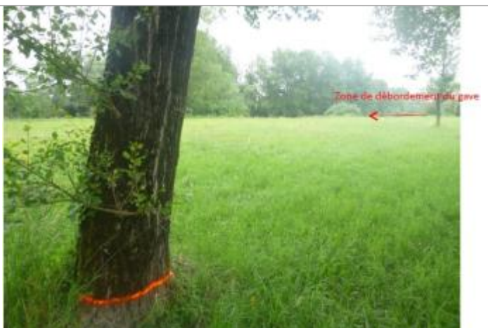
Vue du repère sur l'arbre (la peinture orange représente le niveau atteint par les eaux)