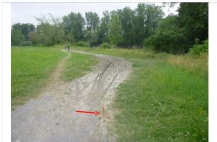
Vue du repère (la flèche rouge représente la limite d'inondation) - Auteur : DDTM 64

Type de repérage : Campagne de terrain post-inondation