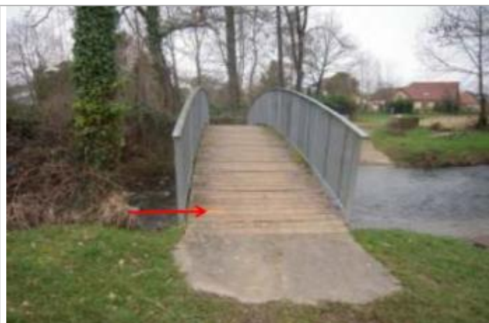
Vue du repère (la flèche rouge représente le niveau atteint par les eaux) - Auteur : HEA/DDTM 64

SOURCE DE REPÉRAGE : RELEVÉ PHE BUREAU D'ÉTUDE HEA POUR LA DDTM 64 (PPRI D'IDRON) - 10/02/2014