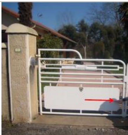
Vue du repère (la flèche rouge représente le niveau atteint par les eaux) - Auteur : HEA