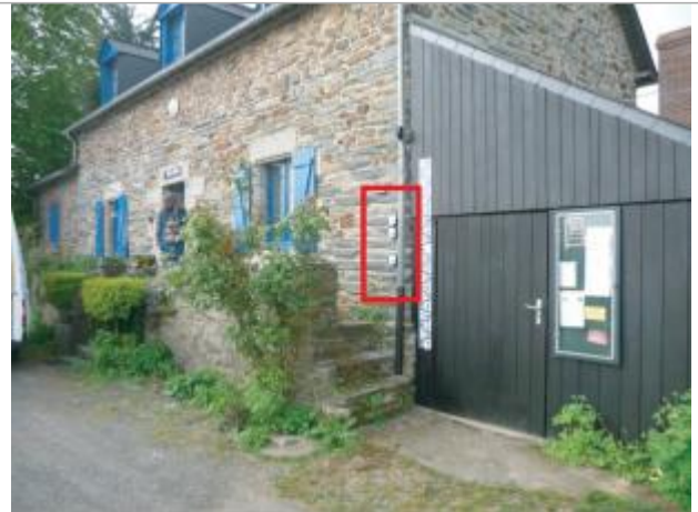
Maison éclusière de Malon

Coordonnées WGS84 : X: -1.84254220 / Y: 47.79796670