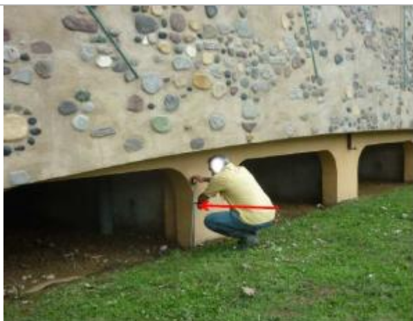
Vue du repère (la flèche rouge représente le niveau atteint par les eaux)

Altitude calculée de l'eau (en m) : 194.4 m