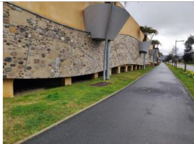
Vue du site depuis la piste cyclable