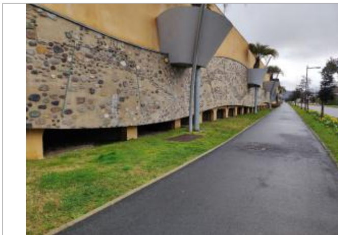
Vue du site depuis la piste cyclable