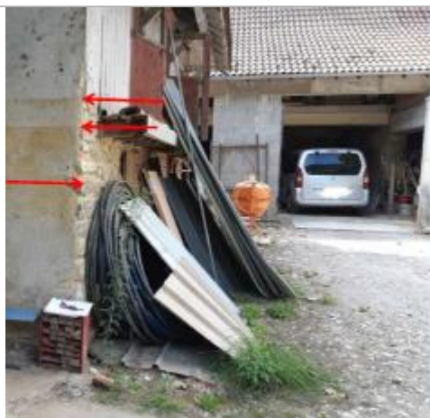
Vue du repère (la flèche rouge du bas représente le niveau atteint par les eaux)