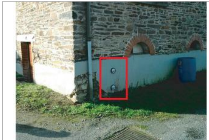
Maison individuelle, 10 rue de l'écluse