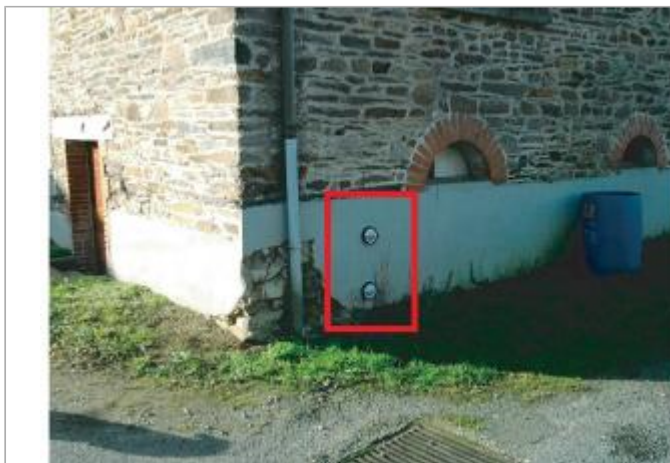
Maison individuelle, 10 rue de l'écluse