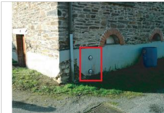
Maison individuelle, 10 rue de l'écluse