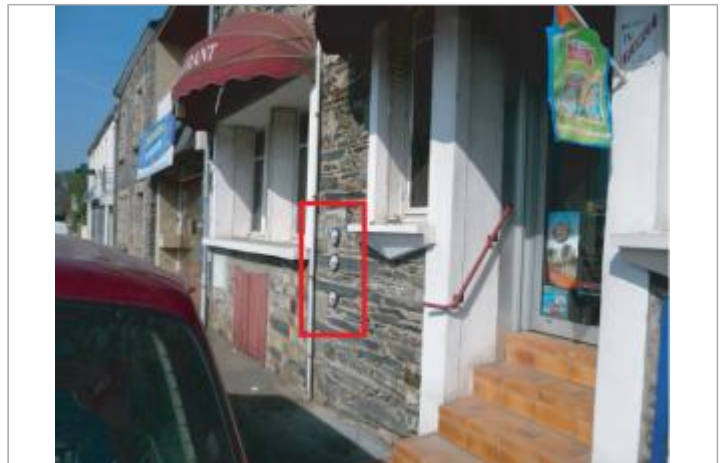
Commerce au 15 quai des Batteliers

Coordonnées WGS84 : X: -1.82375990 / Y: 47.82226560