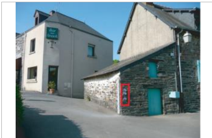
Maison éclusière de Guipry-Messac