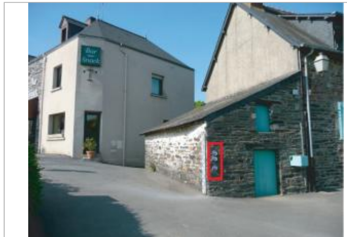
Maison éclusière de Guipry-Messac

Coordonnées WGS84 : X: -1.82255140 / Y: 47.82247920