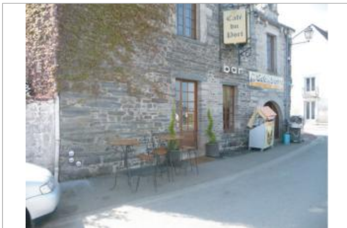
Café, Restaurant, rue de la Résistance