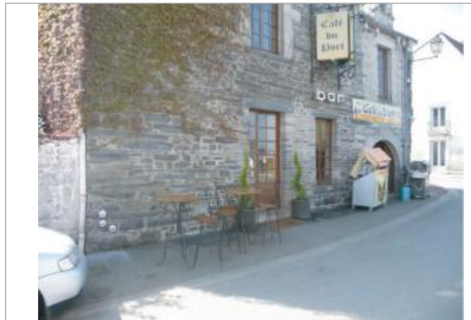
Café, Restaurant, rue de la Résistance