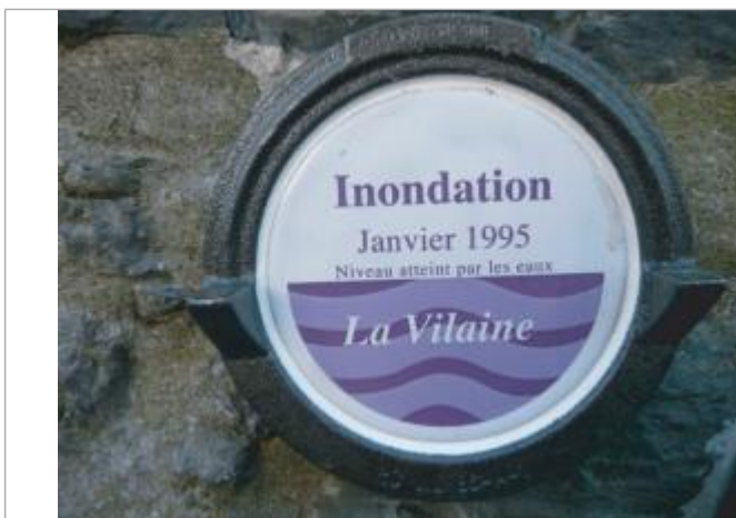
Repère normalisé de la crue de Janvier 1995

Altitude calculée de l'eau (en m) : 8.94 m