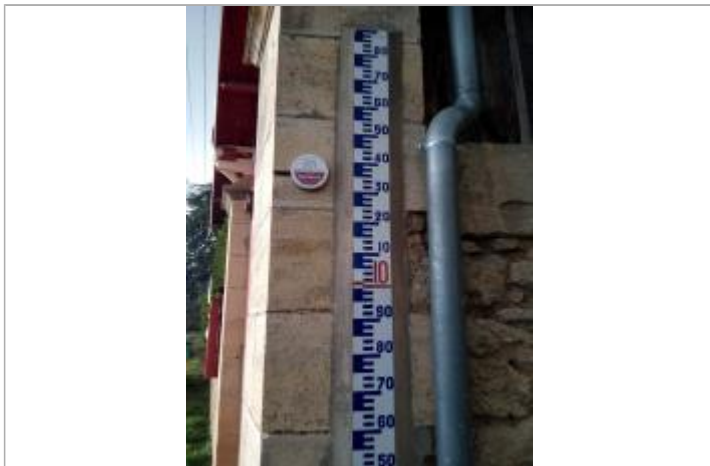
St Pierre d'Aurillac (33)_repère février 2021 aux Arrocs à côté d'une échelle de crue