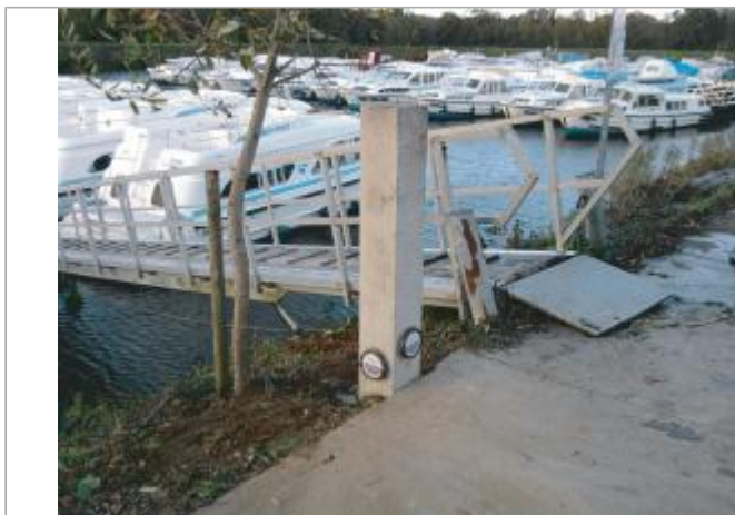
Poteau au port de Messac