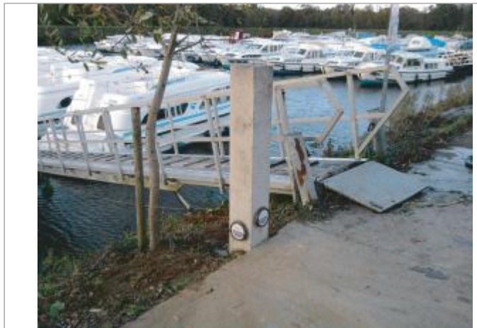
Poteau au port de Messac

Coordonnées WGS84 : X: -1.81427220 / Y: 47.82638700