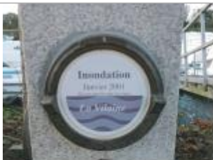
Repère normalisé de la crue de Janvier 2001

Texte : Inondation janvier 2001_La Vilaine