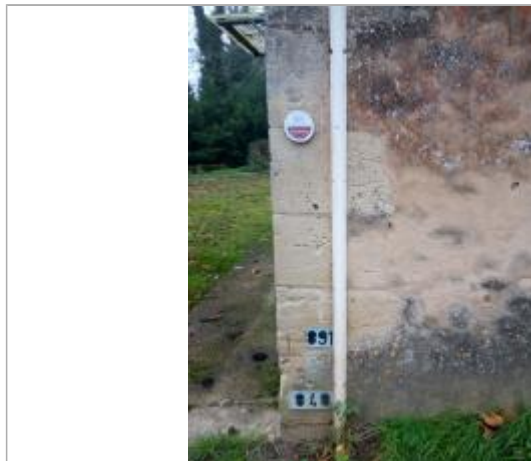
La Réole (33)_repère février 2021 au Rouergue accès camping