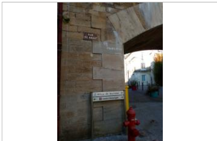
La Réole (33)_plusieurs repères Place du Viaduc