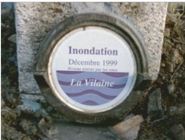
Repère normalisé de la crue de Décembre 1999

Altitude calculée de l'eau (en m) : 8.91 m