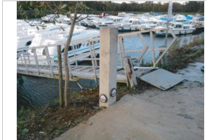
Poteau au port de Messac

Coordonnées WGS84 : X: -1.81427220 / Y: 47.82638700