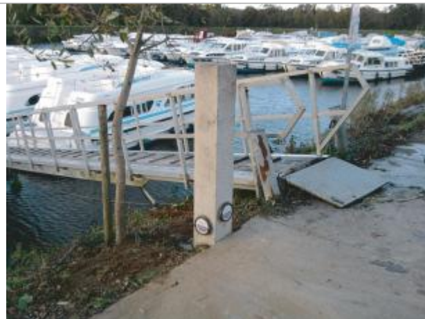
Poteau au port de Messac