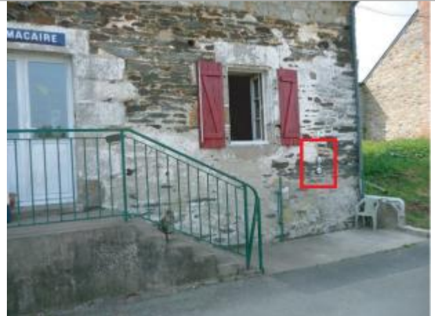
Maison éclusière à Saint-Malo-de-Phily (Macaire)