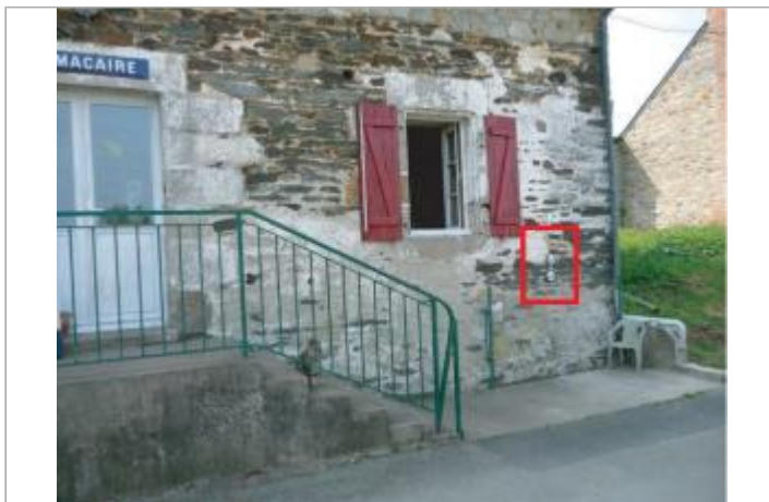
Maison éclusière à Saint-Malo-de-Phily (Macaire)