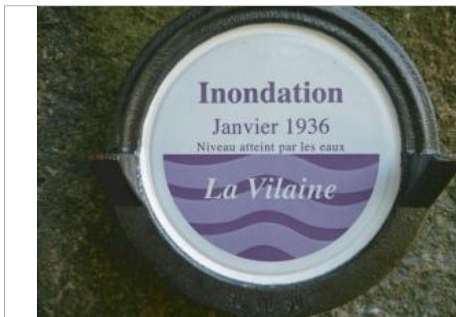
Repère normalisé de la crue de Janvier 1936