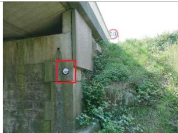
Pile du pont RD42 (Amont), La Bruère